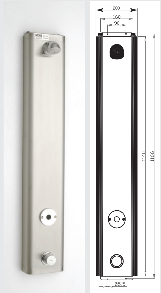
Elektronisk dusjpanel modell DP-4 Therm