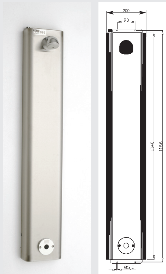
Elektronisk dusjpanel modell DP-3